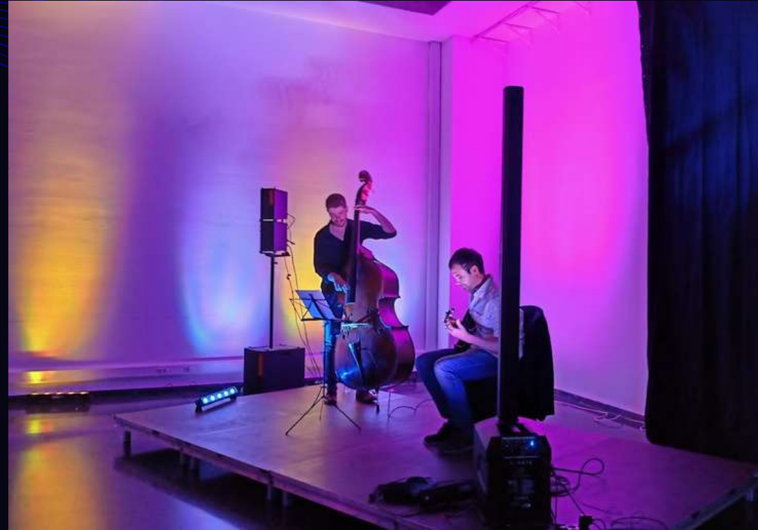
SONORIZACIÓN E ILUMINACIÓN